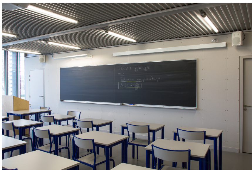
Tableau grande largeur facile à installer et réceptionner.

Les salles de classe, de réunion et de formation, laboratoires et autres think tanks vont enfin pouvoir disposer de larges surfaces murales d'écriture et d'affichage. La gamme HORIZON supprime les contraintes matérielles et financières (escalier menant à la salle de réunion étroit, budget serré) et élargit l'horizon des espaces de communication en proposant des tableaux mesurant jusqu'à 6 mètres de largeur.